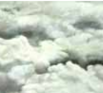
Tomoko Kofuneko · performance/video