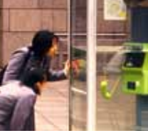
Stefan Rueff · mixed media