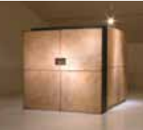
Peter Unsicker · sculpture